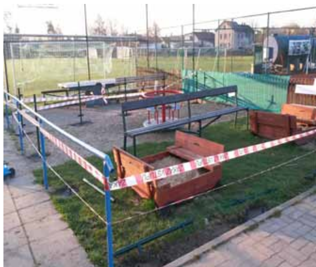
Dětský koutek na hřišti - zahájení prací na oplocení

Biologicky rozložitelný materiál rostlinného původu bude možno soustřeďovat pouze v určené dny 2x týdně a to od 1. dubna do 31. října kalendářního roku. Jedná se o tyto dny: