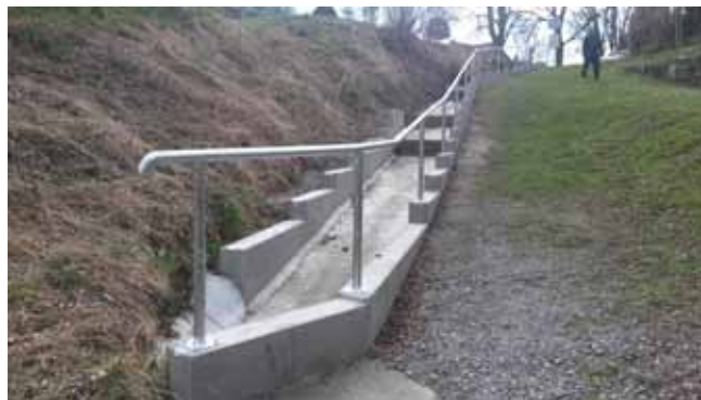
Cesta pod ZŠ - nové zábradlí

Podmínkou pro žádost na jakoukoli „Dotační výzvu“ je zpracování kompletní Projektové dokumentace, v některých případech musí být dokonce již doloženo Stavební povolení na danou akci. Proto jsme nyní opět ve fázi, kdy jsme se přes zimní období maximálně soustředili na zadání co nejvíce podkladů pro zpracování Projektových dokumentací na několik dalších plánovaných akcí. Jedná se „ Vypracování PD na výstavbu chodníku v obci Čistá vč. odvodnění,