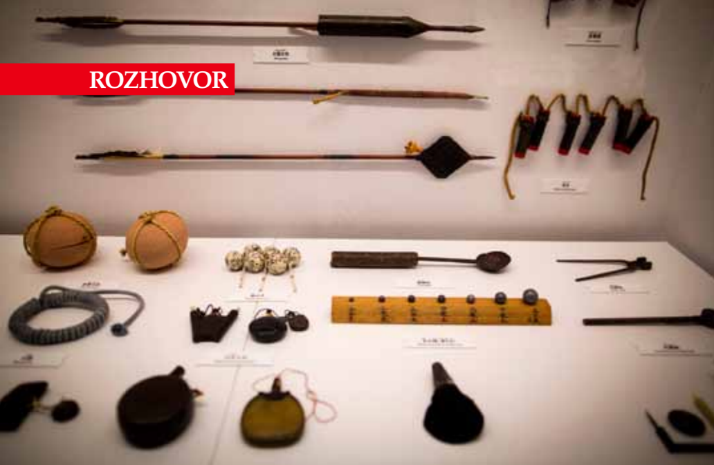
▲ Nindžové byli vybaveni i mnoha zbraněmi (většinou malými, aby se daly dobře skrýt) a nástroji. Třeba vrhací šipy měli ukryté v dlouhé bambusové tyči. Používali rovněž jedy.

chie a když se chci něco naučit, tak jí musím dodržovat. A když něco poruším, tak vím, že za to budu potrestán. Jde o nepsaná pravidla, kterým se u nás říká čest nebo rytířství. V praxi to znamená, že když si podáme ruku, tak to platí a nemusí to být napsáno na papíře. A tohle jsou věci, které jsem tam našel a doma mi chyběly.