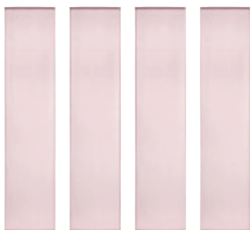
Textilní panel Novel, polyester, cca 60 × 255 cm, Xxxlutz.cz, 399 Kč/ks