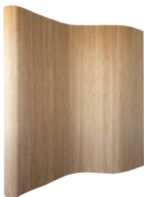
Paraván HS 302 , bambus, 250 × 300 × 0,3 cm, Drstudio.cz, 2120 Kč