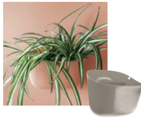
Vertikální systém Eco, recyklovaný plast, 30 × 20 × 20 cm, Uk.wallygro.com, 64,15 €/sada 4 ks