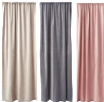
Závěsy , bavlněný samet, 150 × 300 cm, Hm.com, 3999 Kč/2 ks

„Zavlažování rostlin v zelených stěnách je řešeno automatickým zavlažovacím systémem, kdy jsou květiny zalévány v požadovaných intervalech. K tomu je nutné mít připojení na vodu a také na odpad. Voda se ve stěně pomocí cirkulačního systému automaticky obměňuje a zachytává se do vany umístěné pod zelenou stěnou.“